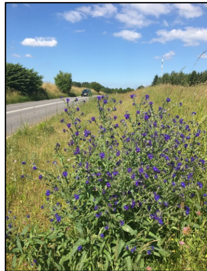
Artsrige blomsterrabatter på Møllerisvej og Harløsevej

Der er udvalgt en række kommunale græsarealer langs større veje, som er omdannet til blomsterenge ved såning af blomsterblandinger med vilde arter, som har en naturlig udbredelse i Nordsjælland. De vejnære arealer er udvalgt for at skabe stor synlighed for kommunens borgere og forskønne bymiljøet.