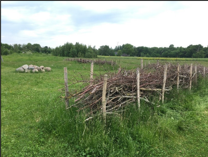
Kvashegn og paddeskjul

I 2021 planlægges projekter på skoler og daginstitutioner der tilgodeser biodiversiteten og giver børn og voksne naturoplevelser.