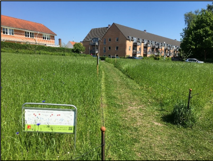
Anlæg af blomstereng ved Løngangsgade. Det første år er det 1-årige arter som f.eks. kornblomst og valmue der kommer op. Til næste år vil de vilde urter blomstre, da de først sætter blomst år 2.