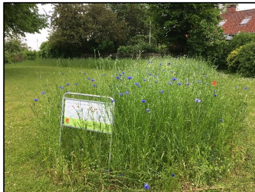
Fuglekasser og blomstereng år 1 (2021) ved Menighedsrådshus i Nr. Herlev