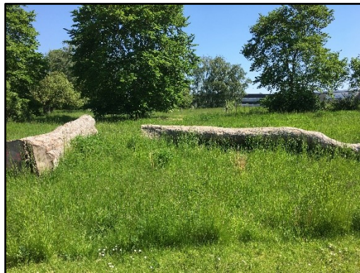
Stammer efterladt til naturligt henfald til insekter og svampe