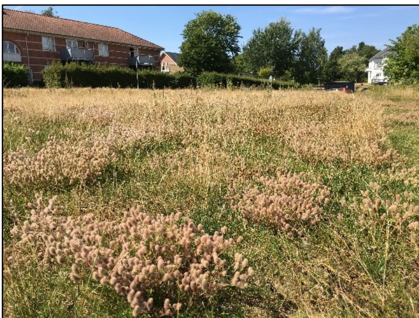
Harekløver ved Rådhusstrædeparkeringen tiltrækker mange nektarsamlende insekter.

I foråret 2020 ophørte græsslåningen på et felt ved Rådhusstrædeparkeringen og på arealer neden for Løngangsgade. Særligt arealet ved Rådhusstræde viste et potentiale for naturlig spiring af vilde blomster som hare-kløver, almindelig røllike, kongelys og katost grundet den grusede jordbund. Flere arter af sommerfugle og bier blev iagttaget.