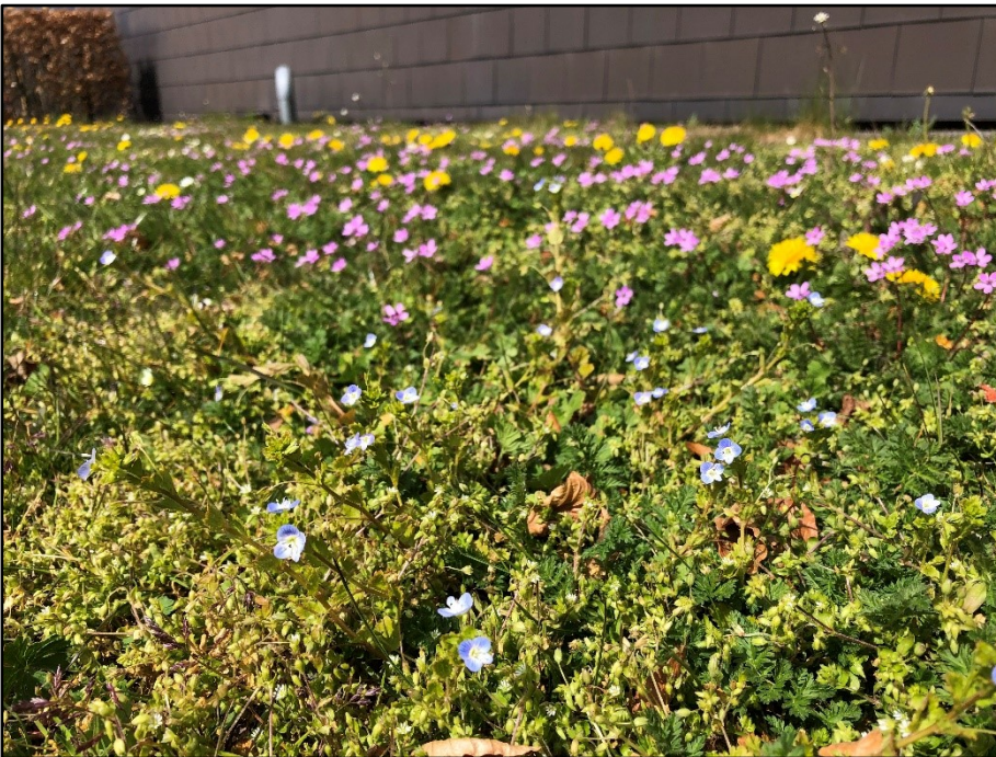
Naturlig blomsterflor ved Hillerød Rådhus

Ved trappen ned til personaleindgangen er der et område som er næringsfattigt. Her er der naturligt kommet en fin flora af hejrenæb, ærenpris, stedmoderblomst, mælkebøtte, rød tvetand, bellis, springklap, m.fl.