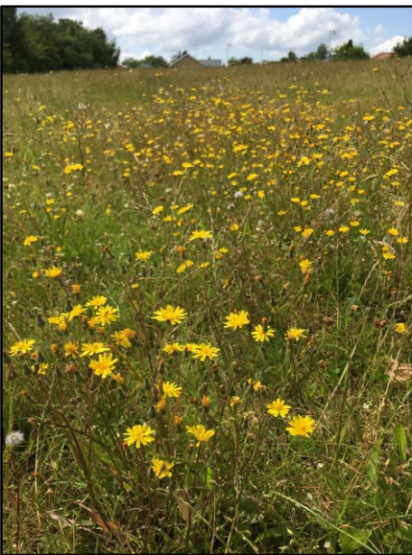
Høgeskæg på areal ved Tulstrupvej

I sommeren 2020 viste arealet et stort potentiale for at udvikle sig til blomstereng. Arter som almindelig røllike, høgeskæg og liden klokke farvede arealet i mosaikker af grønt rødbrunt, hvidt, gult og blå. Arealet er nu udlagt til naturgræs og bliver slået 1 gang i sensommeren med opsamling.