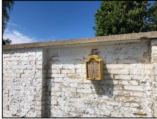
Fuglekasse og insekthotel ved Hillerød Rådhus

Både på rådhusgrunden, og ud for daginstitution ved alléen op til rådhuset, er der udlagt store stammer til naturligt henfald, hvorved de kan blive vigtige levesteder for træboende insekter og vednedbrydende svampe som giver naturoplevelser for børn (og voksne).