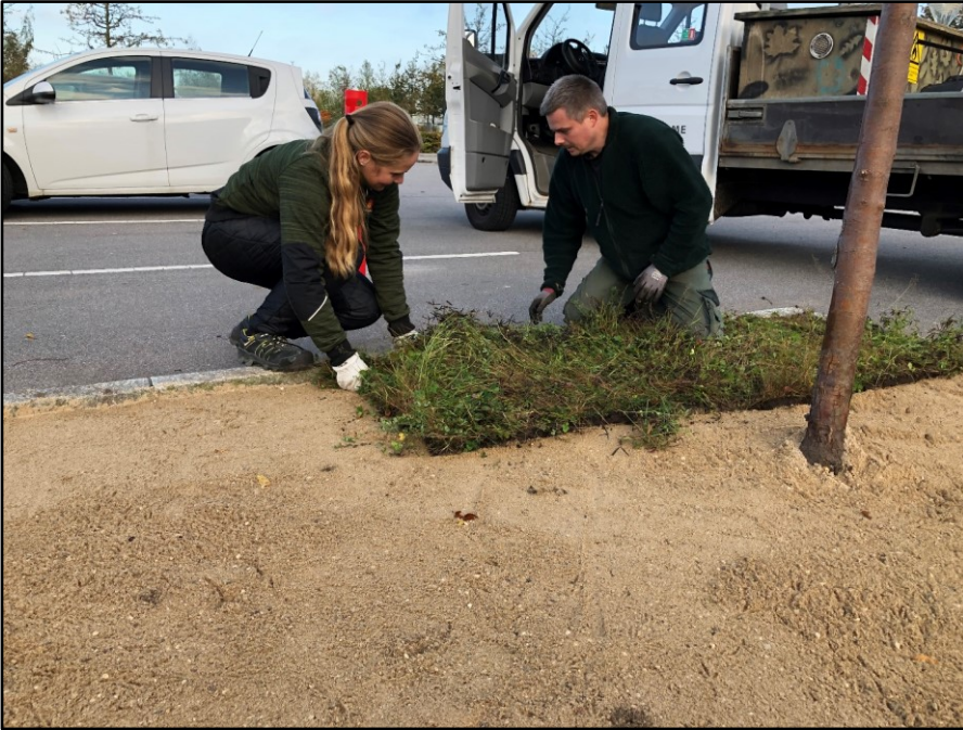
Parkeringspladsen blev i efteråret forsynet med færdige engmætter med salttolerant engvegetation.

Ved trappen ned til personaleindgangen er der et område som er næringsfattigt. Her er der naturligt kommet en fin flora af hejrenæb, ærenpris, stedmoderblomst, mælkebøtte, rød tvetand, bellis, springklap, m.fl.