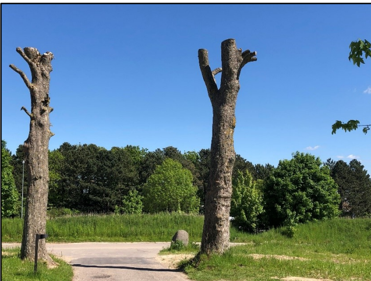
To træ-torsoer for enden af allé op rådhuset

Der er fokus på ikke altid at fælde træer ved roden, der har fået sygdom eller på anden måde er et risikotræ for mennesker. Ved allén op til Hillerød Rådhus er to træer der havde fået svamp blevet topskåret i stedet for at blive fældet helt. Nu er trætorsoerne til glæde for spætter, insekter, svampe mv. uden træerne er til fare for mennesker.