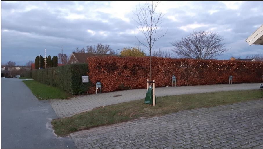
Nyplantet træ i Møllegårdens vejlaug

Der er i 2020 indgået et partnerskab med to grundejerforeninger omkring plantning af træer. I Grundejerforeningen Selskovsparken plantet 8 egetræer på et fællesareal. I samarbejde med Møllegårdens Vejlaug er der på fire veje plantet 12 træer i private forhaver med henblik på at begrønne træfattige villaveje. De valgte træarter almindelig røn og paradisæble har desuden smuk blomstring og bær/frugter til fuglene.