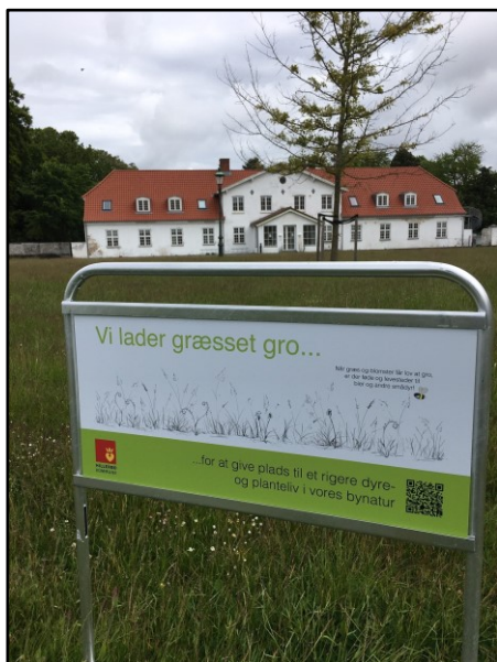
Nyt skilt til formidling af områder med naturgræs, opsat foran rådhuset på ny naturgræseng

For at synliggøre indsatsen omkring naturgræs, og for at vise at det ikke bare er gartneren, der har glemt at komme forbi, er der blevet udviklet et skilt af den lokale naturformidler Signe Wozniak