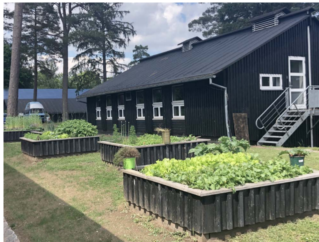
Fælleshave ved Skovskolen i Nødebo