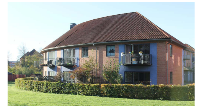
Boliger på Løngangsgade i Hillerød By

I lokalplaner stilles krav til størrelser og boligtyper, som skaber boligvariation i lokalsamfundet, bydelen eller bebyggelsen afhængig af projektets størrelse.