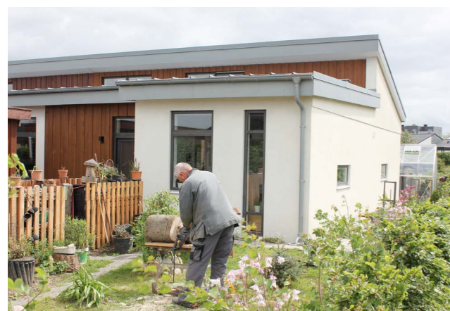
Boliger i Sophienborgområdet