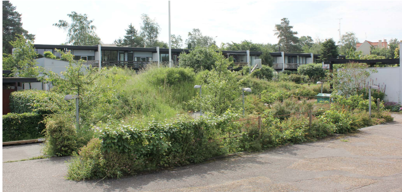
Bofællesskabet Sættedammen, Ny Hammersholt