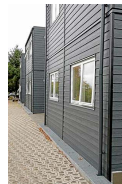
Skæve boliger ved Slangerupgade 60

Der samarbejdes bredt på tværs af forvaltningerne og med eksterne interessenter omkring løbende afdekning af behovet af billige boliger.