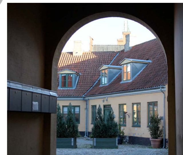
Baggårdsbebyggelse i Hillerøds bykerne

Der gives mulighed for omdannelse i Hillerød By, såfremt det bidrager positivt til byen.