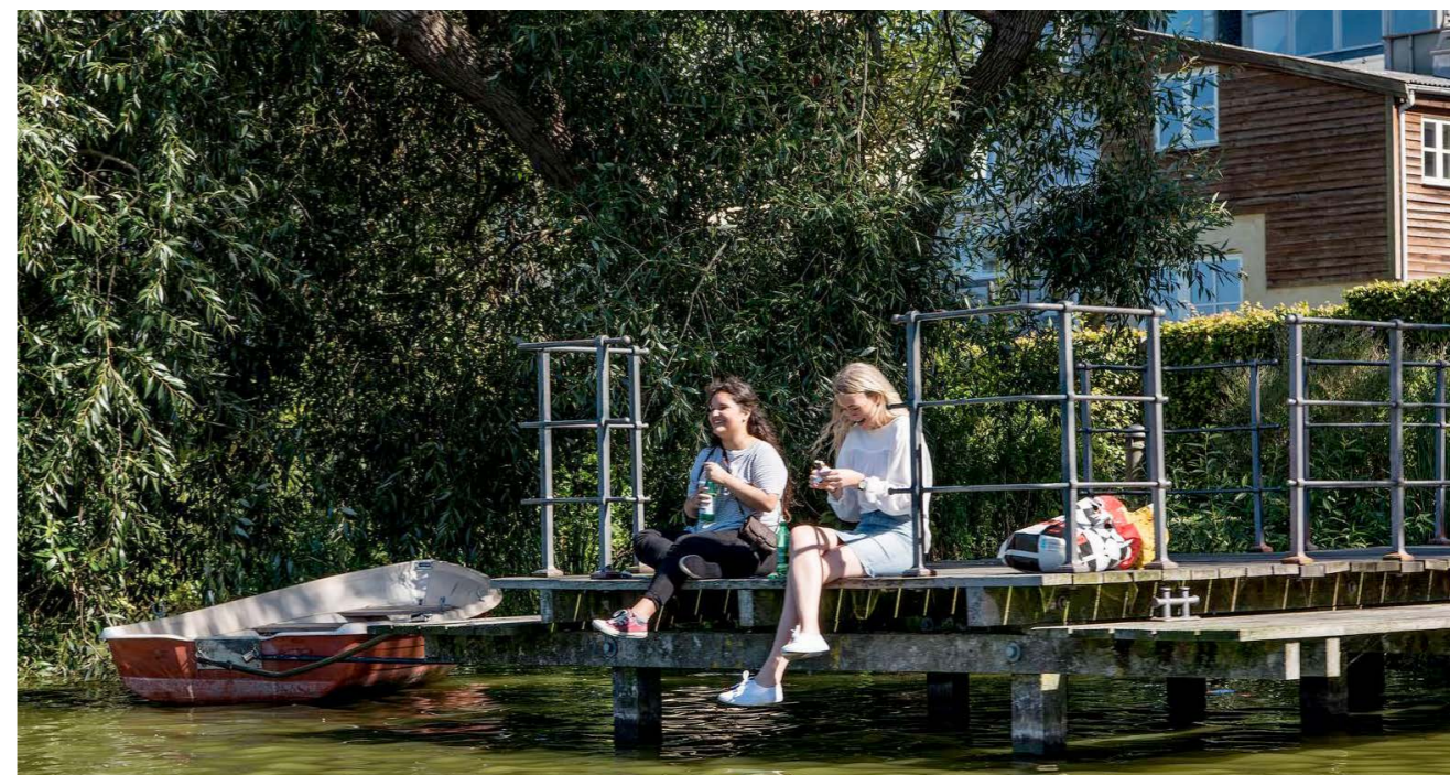
Åndehul ved Slotssøen