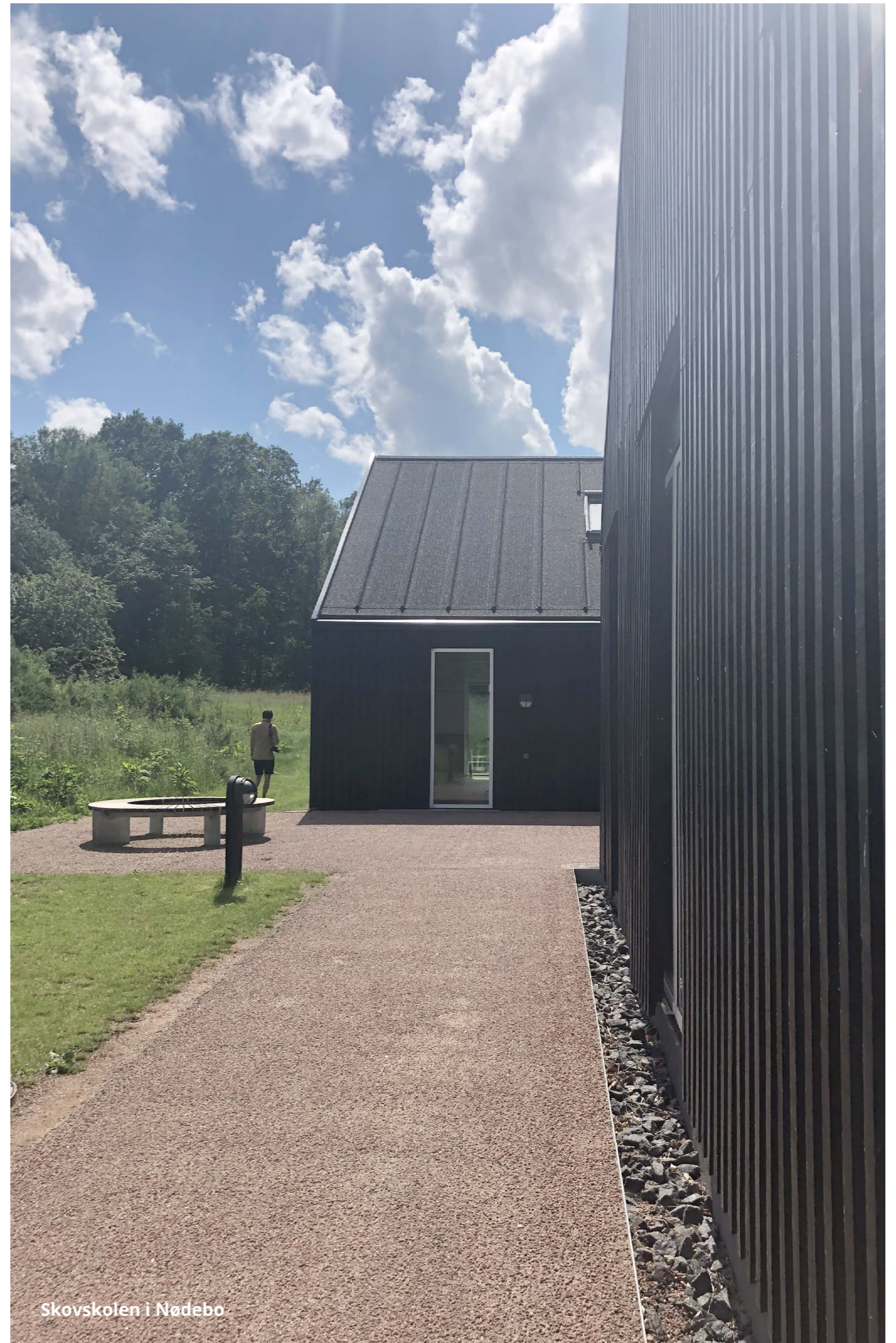
Skovskolen i Nødebo

Gennem udbud, den fysiske planlægning samt dialog med udviklere fokuseres på at få skabt grobund for og oprettelse af bofællesskaber.