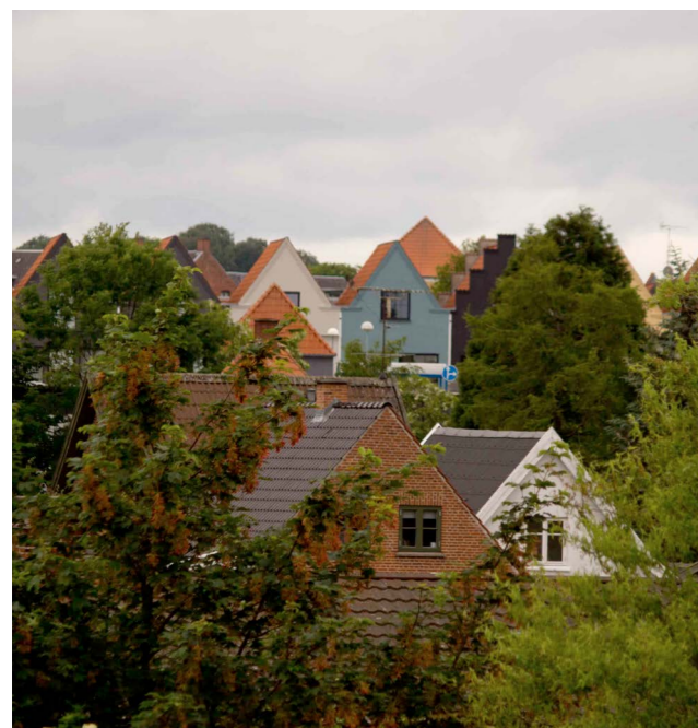
Tagrygge, Hillerød By