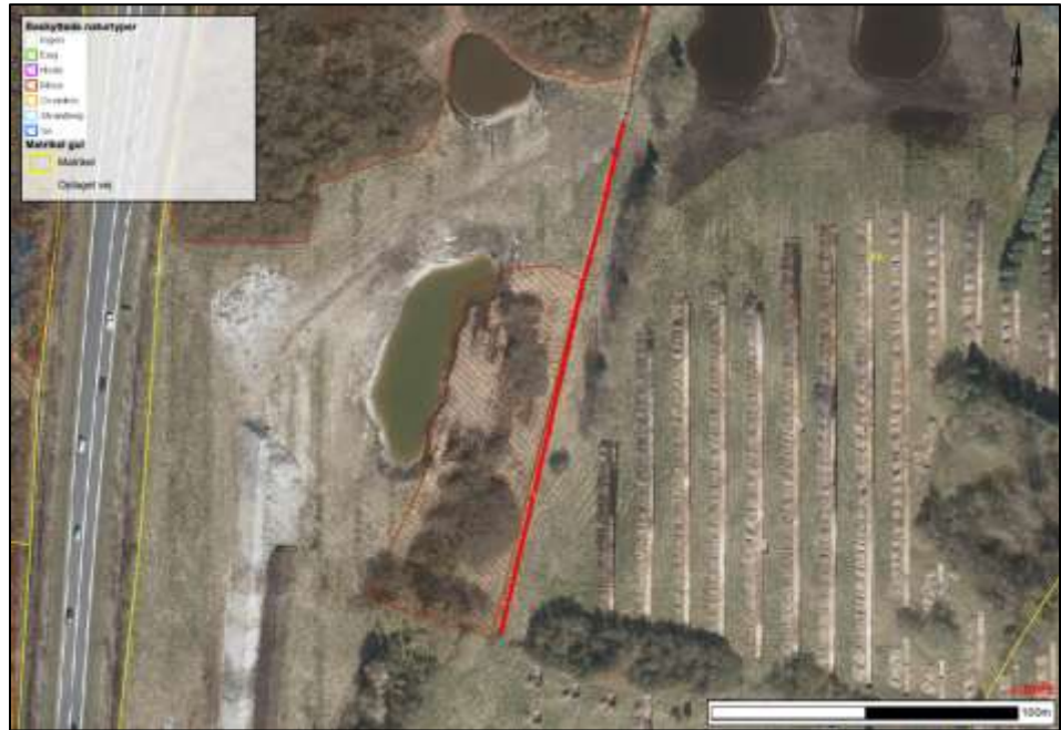
Figur 3: Beskyttet natur. Den røde linje markerer delstrækningen st. 0-172 af Stenfeltslillegrøften, der ønskes sløjfet. Matrikelstel er angivet ved de gule streger. Beskyttede naturtyper er angivet med signaturforklaring i øverste venstre hjørne. Målestok er angivet i nederste højre hjørne.