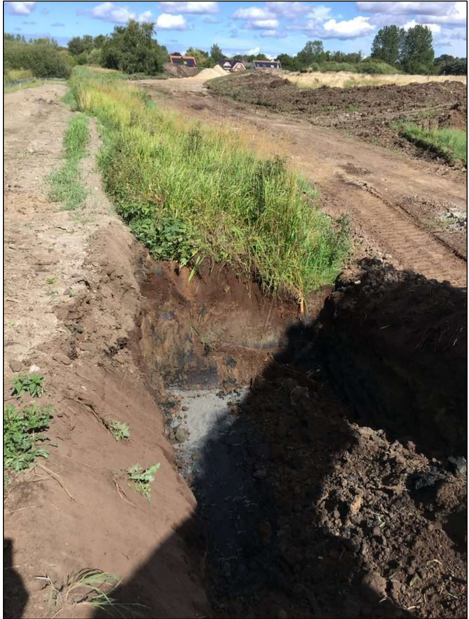
Foto 1: Foto af starten af Stenfeltslillegrøften i station 0. Fotoet er taget i nedstrøms retning og viser den søgegravning, der blev foretaget for at lokalisere eventuelle rørtiløb i starten af vandløbet. Foto er taget den 24. august 2020.