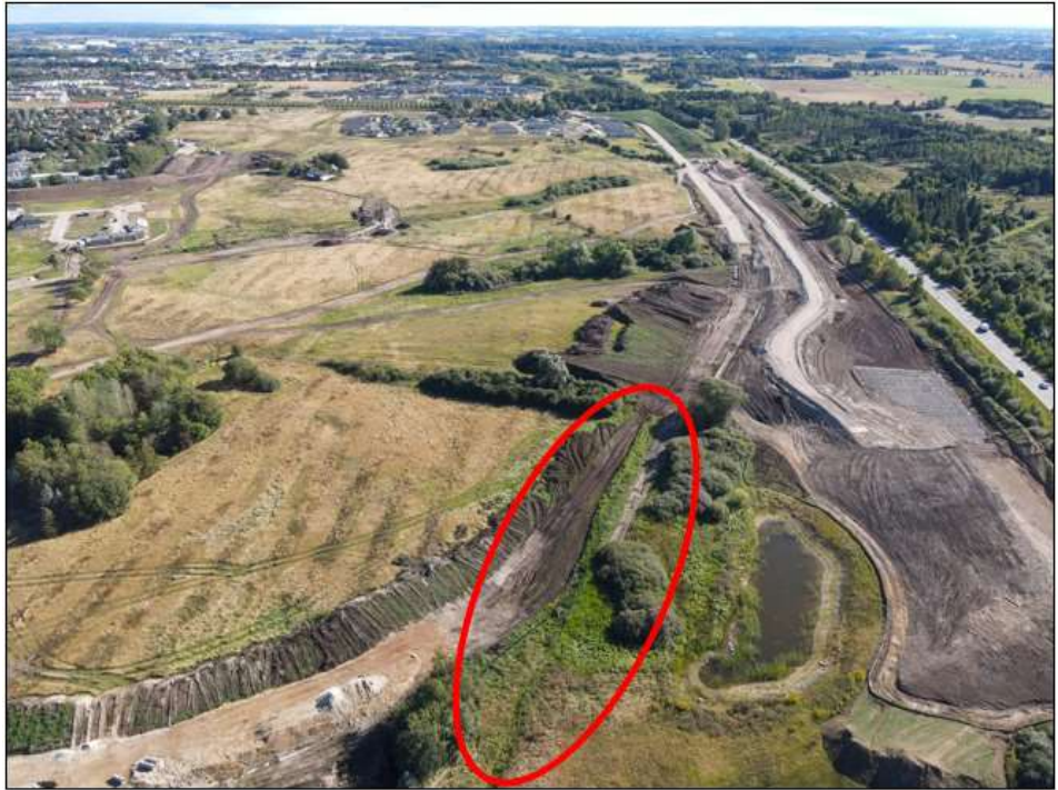
Foto 2: Dronefoto af starten af Stenfeltslillegrøften. Foto er taget i opstrøms retning og viser starten af vandløbet, der er omkranset af en rød polygon. Af fotoet kan man også ane det planlagte vejtracé. Foto er taget den 30. august 2020.