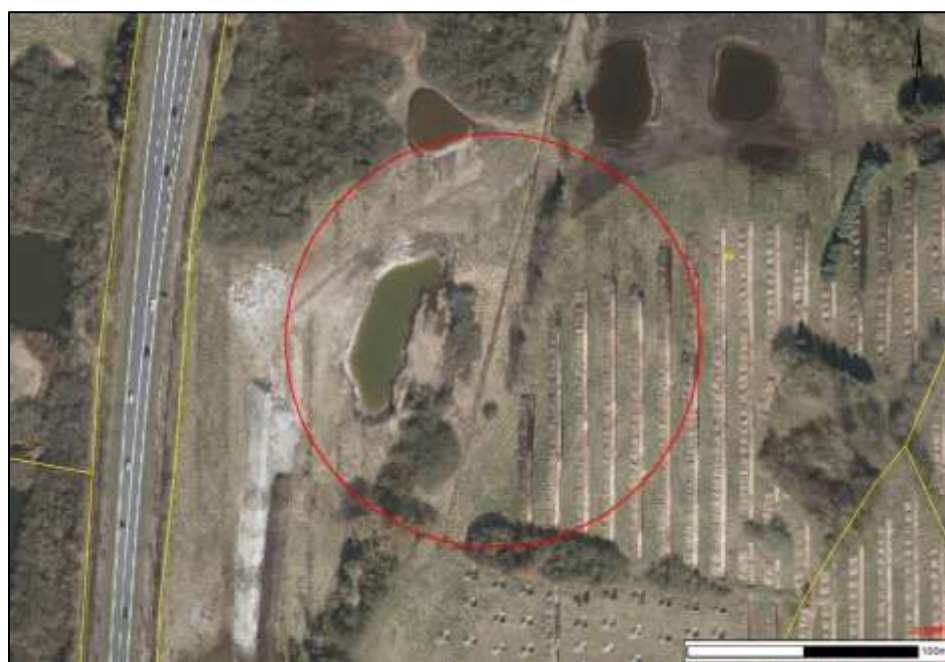
Figur 2: 2019 luftfoto. Den røde cirkel markerer delstrækningen st. 0-172 af Stenfeltlillegrøften, der ønskes sløjfet. Målestok er angivet i nederste højre hjørne.