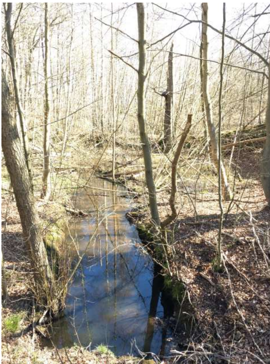
Foto er taget fra Nødebovej og nedstrøms. Sandfanget etableres her, og afgravet materiale udlægges på højre side (sydlige side)

Foto fra området hvor sandfang skal etableres: