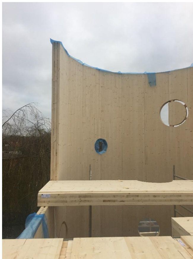
Foto: eksempel på anvendelse af CLT

Nærmere beskrivelse af udbud samt udbudsmateriale vil fremgå af materialet, der vil blive udsendt i august.