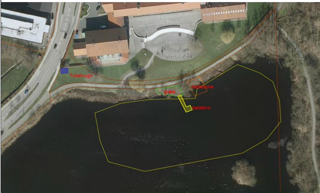
Figur 1 Placering af de ansøgte badeanlæg ved Teglgårdsøen

Hillerød Kommune har den 18. marts 2020 fremsendt en ansøgning, der omfatter etablering af badebro i Teglgårdsøen ud for Frederiksborg Gymnasium og HF og etablering af badezone. Placering og anlæg i Teglgårdssøen er vist på fig. 1 nedenfor.