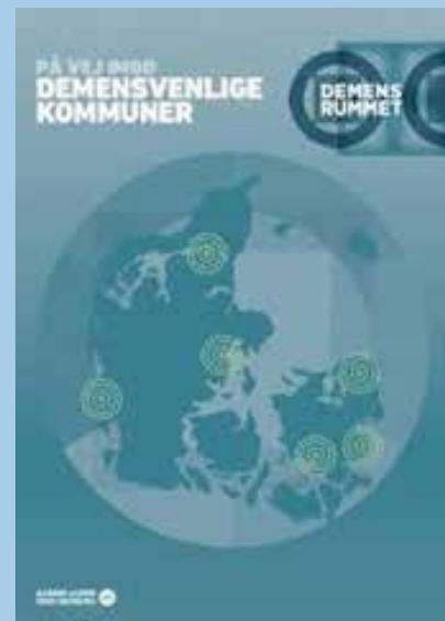
Publikationen "Demensrummet: På vej imod demensvenlige kommuner" kan downloades på www.demensalliancen.dk

Hillerød Kommune er ikke længere aktiv i demensalliancens arbejde. Vi har lært meget, og har valgt at bruge denne viden og vores tid til at fokusere på at skabe gode rammer for mennesker med demens og deres pårørende lokalt i Hillerød