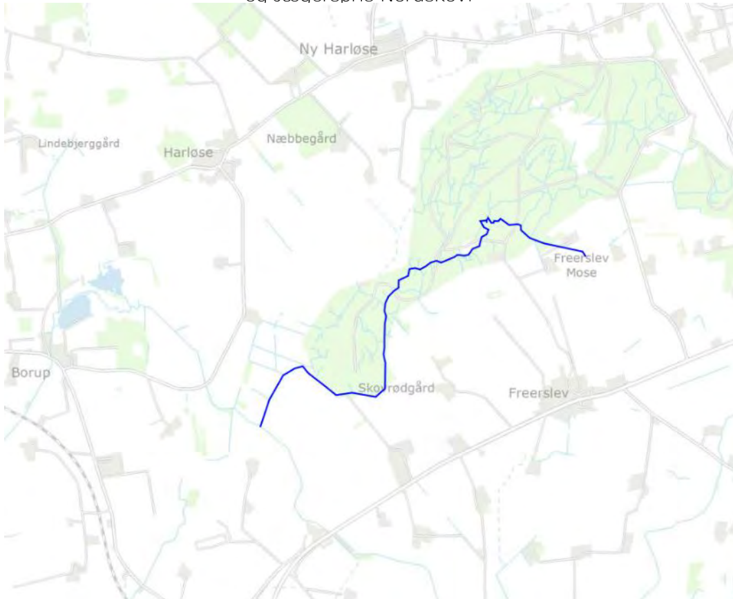
Oversigtskort. Den brede blå linje markerer det samlede projektstrækning i Freerslevhegngrøften

Natura2000: Projektstrækningen i Freerslevhegngrøften er ikke beliggende inden for et Natura 2000-område. Havelse Å udmunder, ca. 17,1 vandløbskilometer (ca. 10,0 kilometer i fugleflugt) nedstrøms for projektområdet i Roskilde Fjord. Roskilde Fjord er en del af Natura 2000-område nr. 136 Roskilde Fjord og Jægerspris Nordskov.