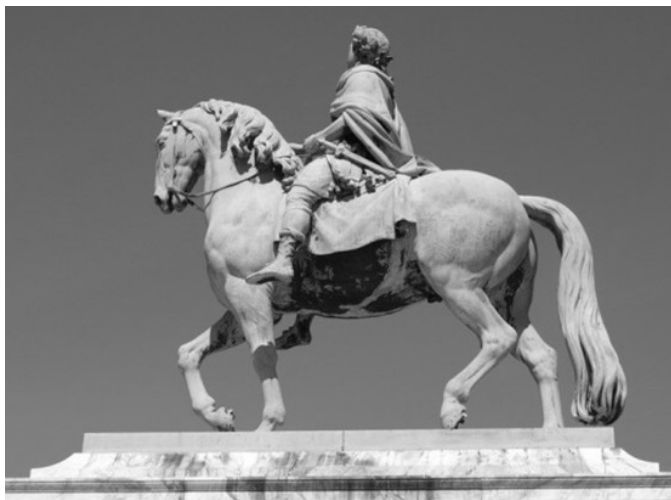
Sådan skulle en rigtig Frederiksborghest se ud! (Salys rytterstatue af Frederik V på Amalienborg Slotsplads.)

Med forbillede i det franske hof ønskede kongehuset pomp og pragt ved de kongelige ceremonier. Det Kongelige Stutteri skulle kunne levere forspand af helt ens heste både i farve, aftegninger og størrelse. For at lave sådanne heste, delte man stoddene (en hoppeflok) op efter farve og drev renavl inden for de forskellige farvede stod: rent røde heste, sorte heste, skimlede heste og allerfornemst af dem alle - det hvide stod, der leverede hvide heste til kongens karosse.