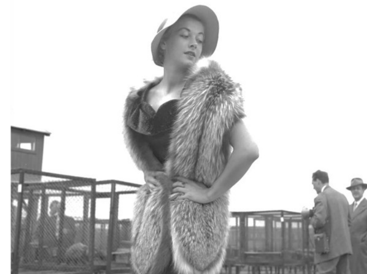
Sølvræv på fotomodellen og i burene bagved.

Hollywood stjerner og jetsettet lod sig gerne se i minkpels, og med industrialiseringen og den øgede velstand i samfundet ønskede flere og flere almindelige kvinder også at svøbe sig i pelsværk. Efterspørgslen på skind voksede.