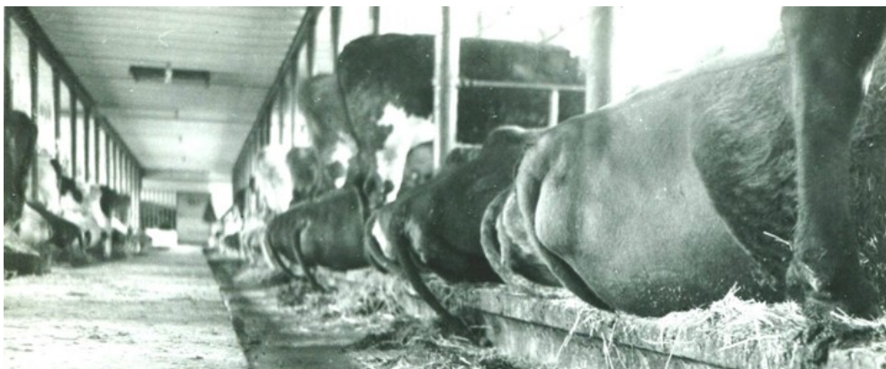
Alt blev målt og vejret. Både det, der kom ind i koen, og det, der kom ud igen.

I 1970 kunne en undrende offentlighed således læse i Frederiksborg Amts Avis om køer med en lille "lem" i maven, hvorfra forskerne kunne udtage prøver af indholdet i koens vom.