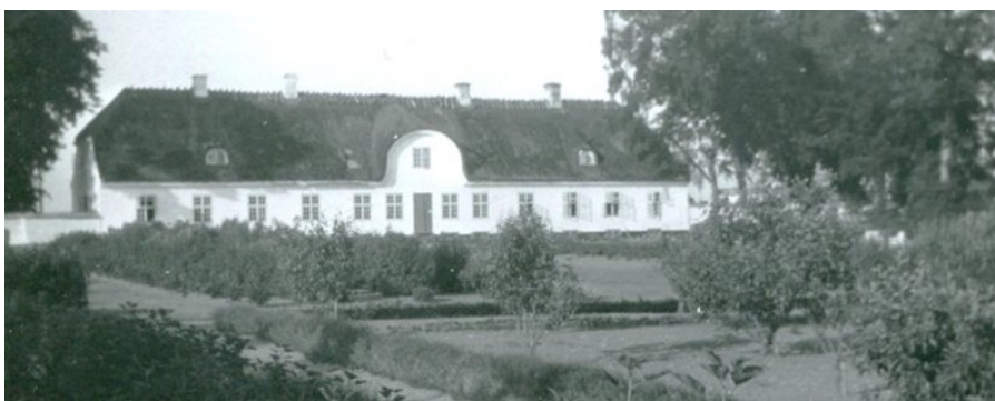
Et kig ind i den smukke frugthave bag Det Hvide Hus.

De gamle, krogede æbletræer har stået på deres plads på bakketoppen i næsten 175 år. Trollesminde avlsgård blev opført i 1838, og straks derefter gik man i gang med en omfattende beplantning af jorden. Gran, lærk, elm, poppel, kastanje og ahorntræer, samt hundredevis af frugttræer og -buske: æble, kirsebær, blomme, stikkelsbær, ribs, solbær og et langt nøddehegn. Et ambitiøst projekt, som desværre ikke havde de efterfølgende forpagteres store bevågenhed. I dag står æbletræerne tilbage sammen med nøddehegnet og de gamle træer i haven bag Det Hvide Hus og ikke mindst den flotte kastanieallé som tavse vidner til historiens gang. 175 år er trods alt ikke så længe i et træs liv.