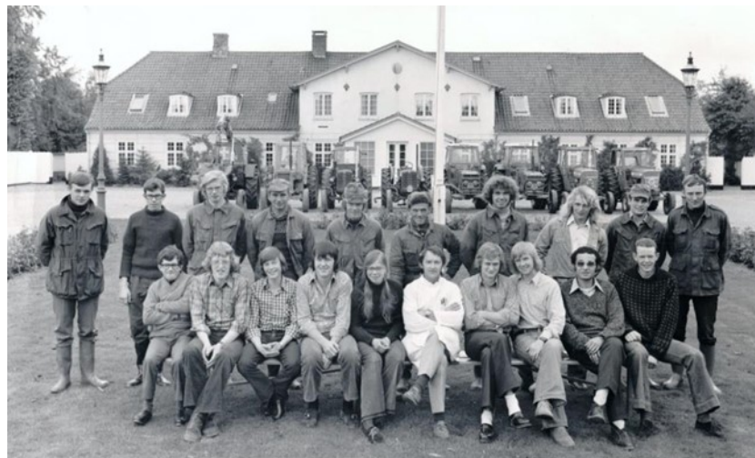
Klasserfoto fra de tidlige 70'ere. Også traktorerne er kommet med på billedet.

Kosten var god og nærende og i høj grad baseret på selvforsyning af kød, æg, grønt og frugt fra mark og stald. Køkkenregionerne blev ledet af inspektørens hustru, en husjomfru, en kokkepige og 3 husholdningselever, der sørgede for bespisning af ansatte og elever.