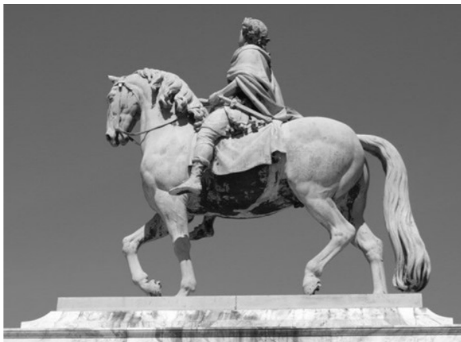
Sådan skulle en rigtig Frederiksborghest se ud! (Salys rytterstatue af Frederik V på Amalienborg Slotsplads.)

Med forbillede i det franske hof ønskede kongehuset pomp og pragt ved de kongelige ceremonier. Det Kongelige Stutteri skulle kunne levere forspand af helt ens heste både i farve, aftegninger og størrelse. For at lave sådanne heste, delte man stoddene (en hoppeflok) op efter farve og drev renavl inden for de forskellige farvede stod: rent røde heste, sorte heste, skimlede heste og allerfornemst af dem alle - det hvide stod, der leverede hvide heste til kongens karosse.