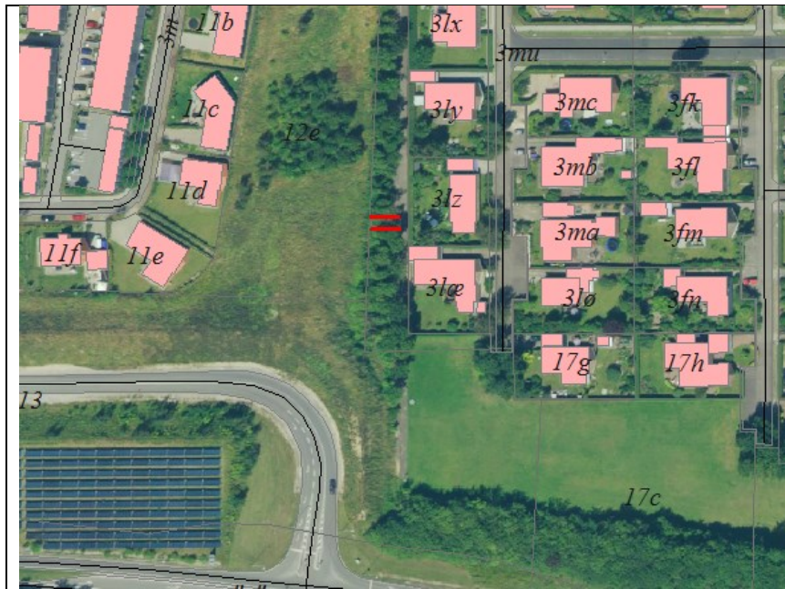
Kort over området ved Solbuen. Den planlagte placering af broen er markeret med røde streger.