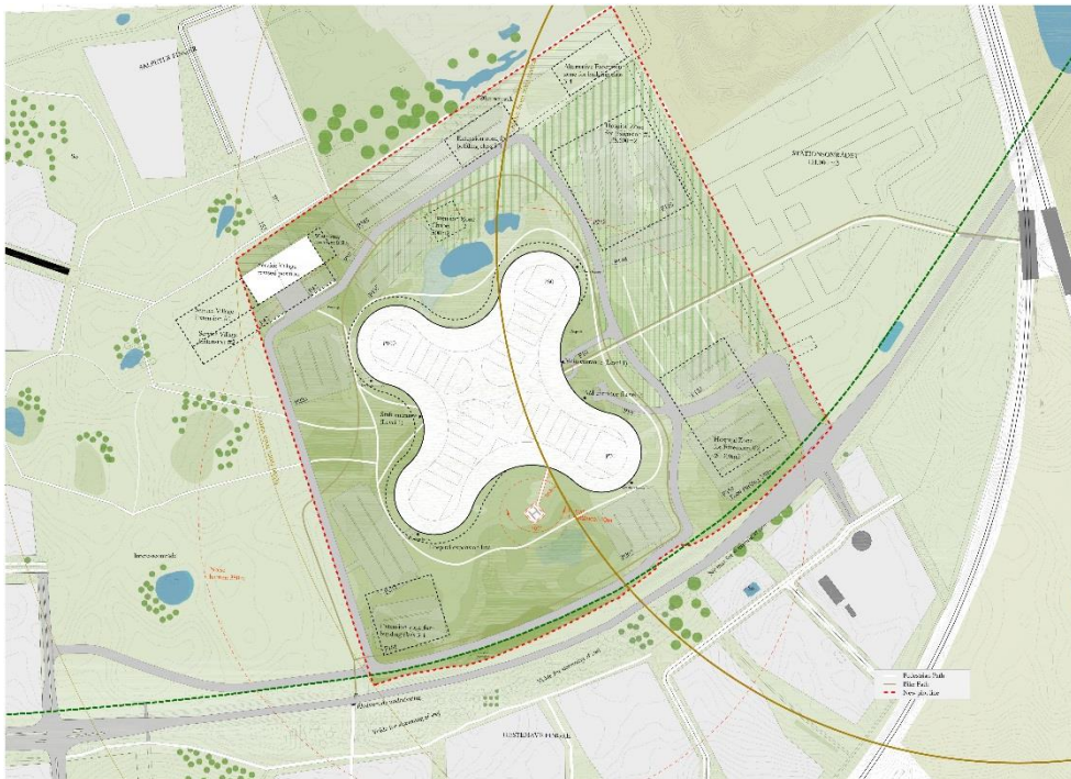
Figur 3 Situationsplan af Nyt Hospital Nordsjælland af 17. august 2015.