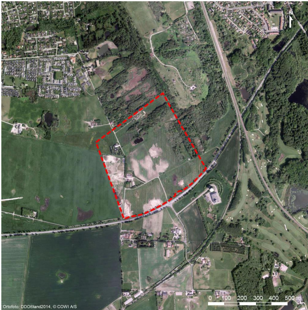
Figur 2 Placering af projektområdet i Favrholm syd for Hillerød by.

Nyt Hospital Nordsjælland skal opføres i området Favrholm syd for Hillerød og får et bruttoetageareal på ca. 124.000 m 2 . Grunden, som er reserveret til hospitalet, er ca. 30 ha, og der er desuden vest for denne reserveret ca. 15 ha til eventuelle fremtidige udvidelser, herunder psykiatri. Der vil blive bygget en ny station nær hospitalet, som kan betjene både S-banen og lokalbanen. Der planlægges med op til 2.800 parkeringspladser. Der er på nuværende tidspunkt kalkuleret med en helikopterlandingsplads til hospitalet, men det vides ikke, om og i så fald hvornår denne realiseres. Placeringen af Nyt Hospital Nordsjælland fremgår af figur 2.