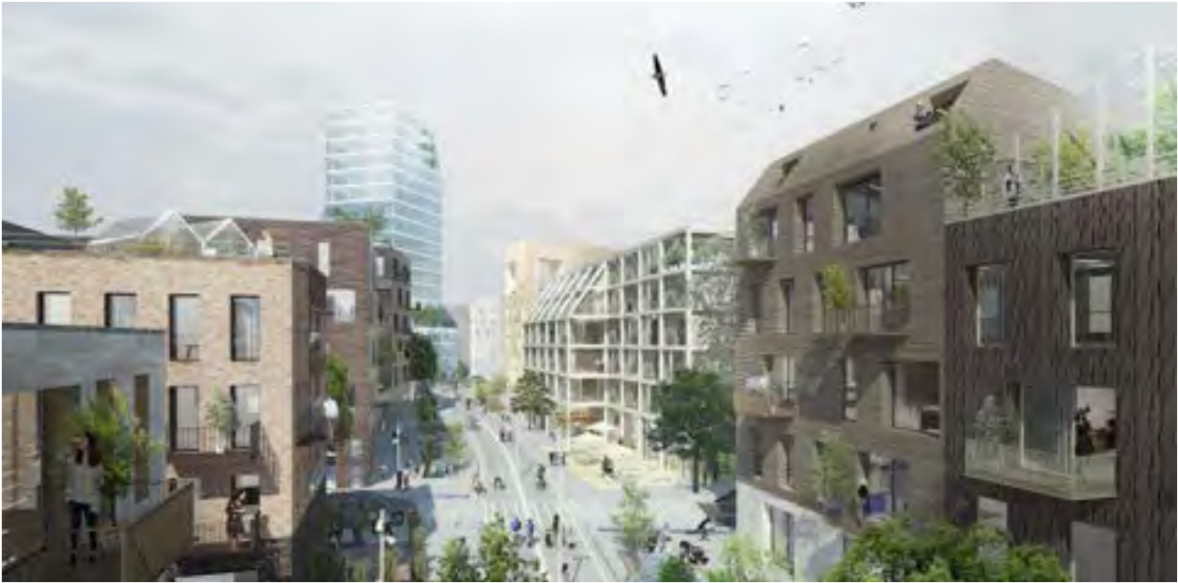
Foreløbig principvisualisering af nyt stationsområde ved Favrholm: I nye bydele, som eksempelvis Favrholm, skal der skabes harmoniske by-hierarkier hvor enkelte byggerier i højden bliver særlige landemærker i bybilledet.