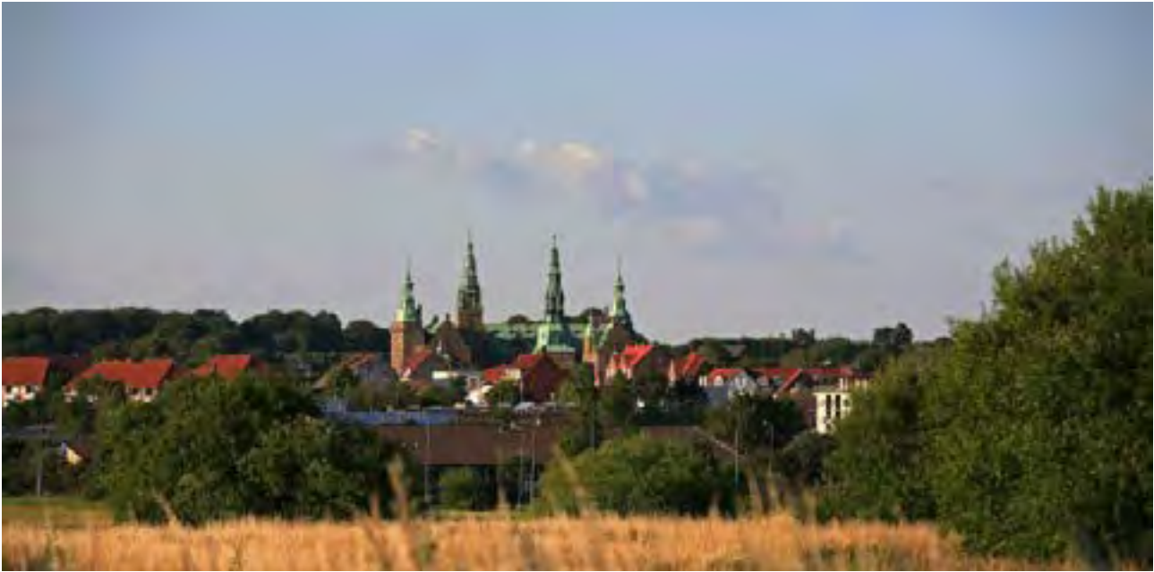
Frederiksborg slot danner det naturlige centrum i Hillerød by