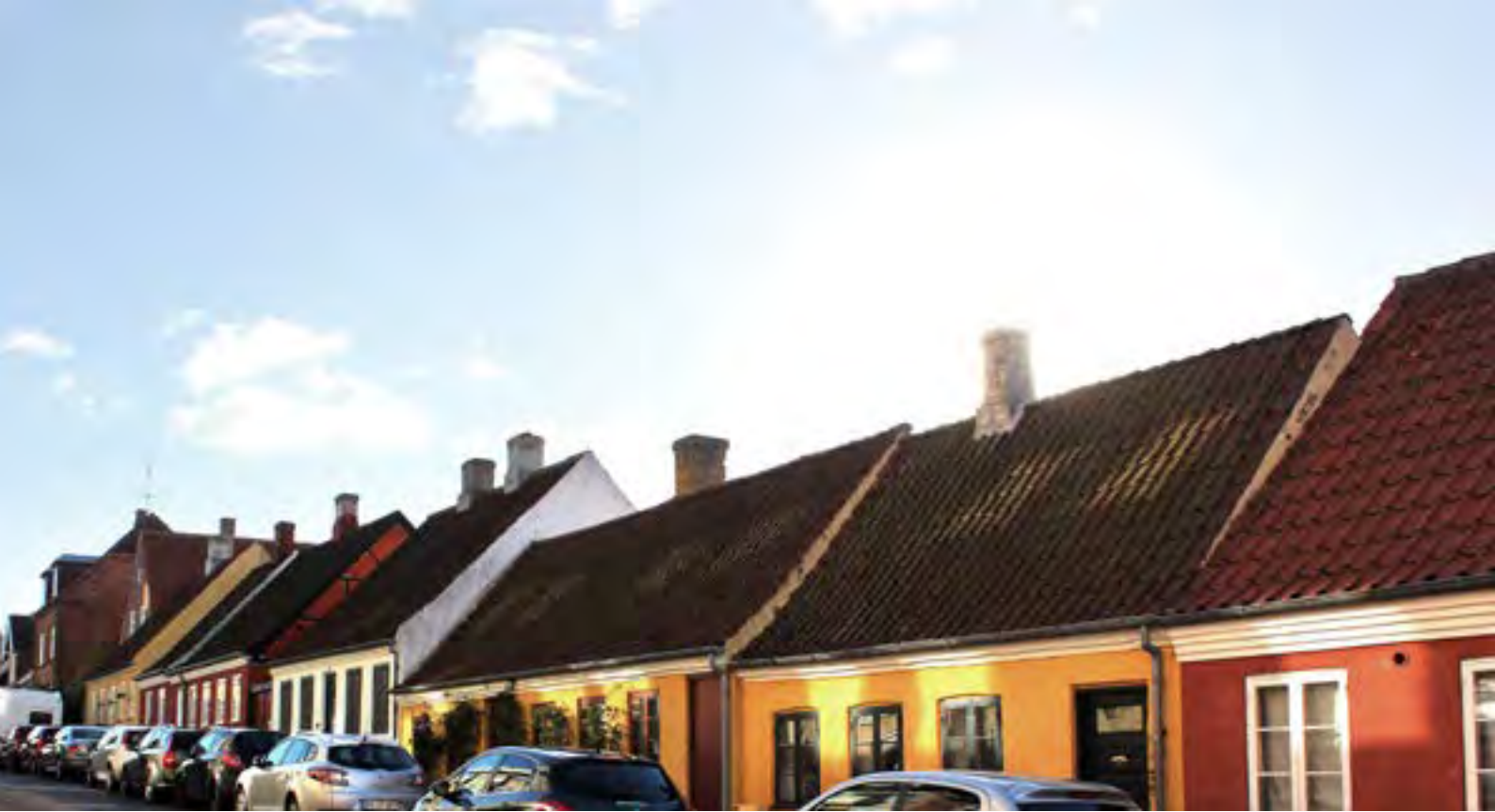
De gamle købstadshuse i Hillerøds Bakkegade udgør både som enkelthuse og sammenhængende gadeforløb kulturværdier som vi skal værne om.