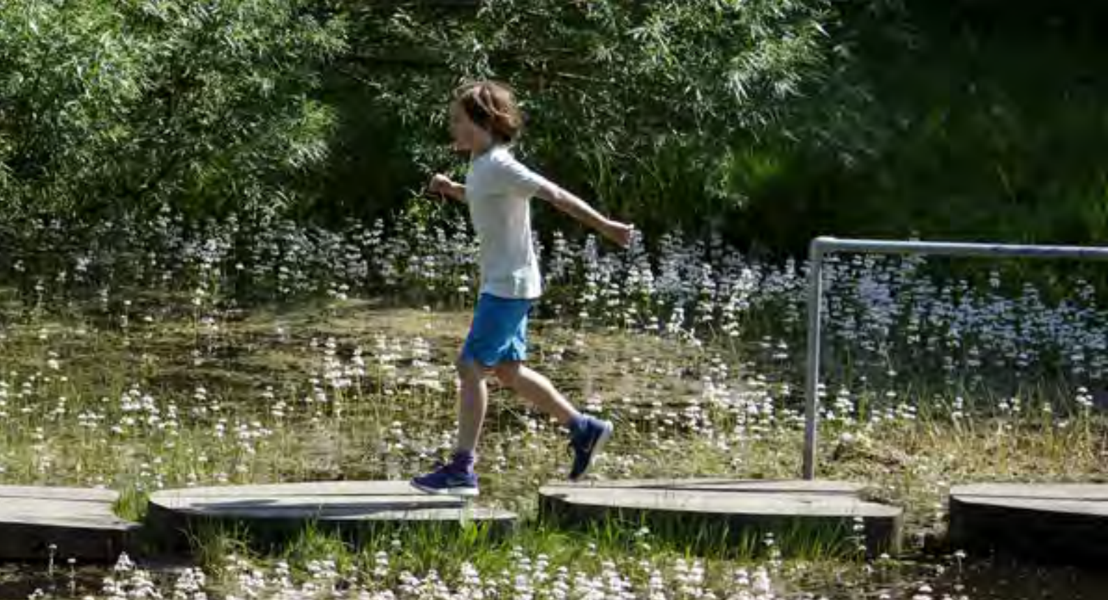
Legeplads ved Grønnevang skole, Østervang