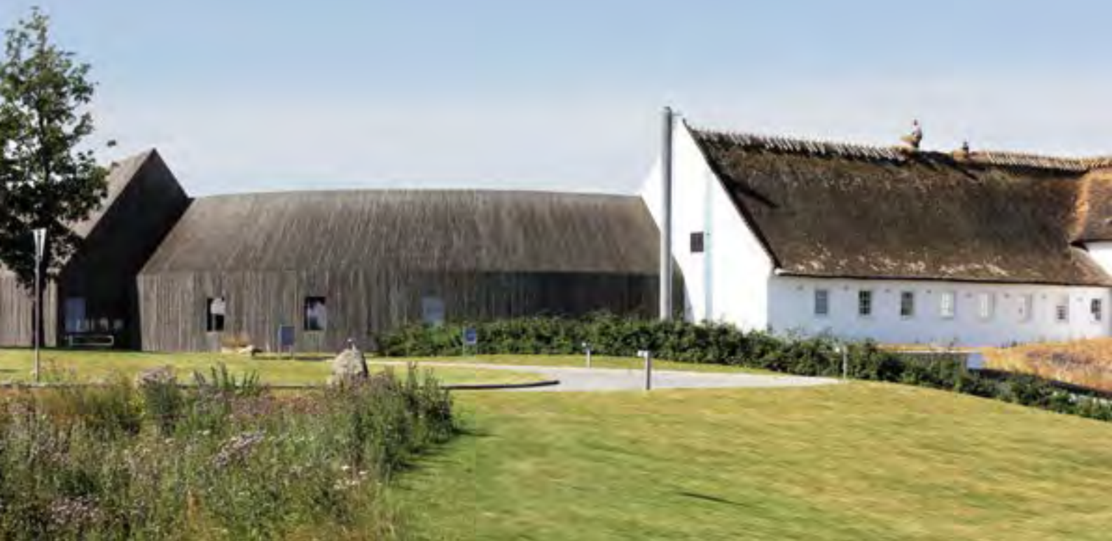
Novo Campus Favrholt (2011), SeArch (Holland). Eksempel på en nutidig tilføjelse til de gamle gårdlænger.