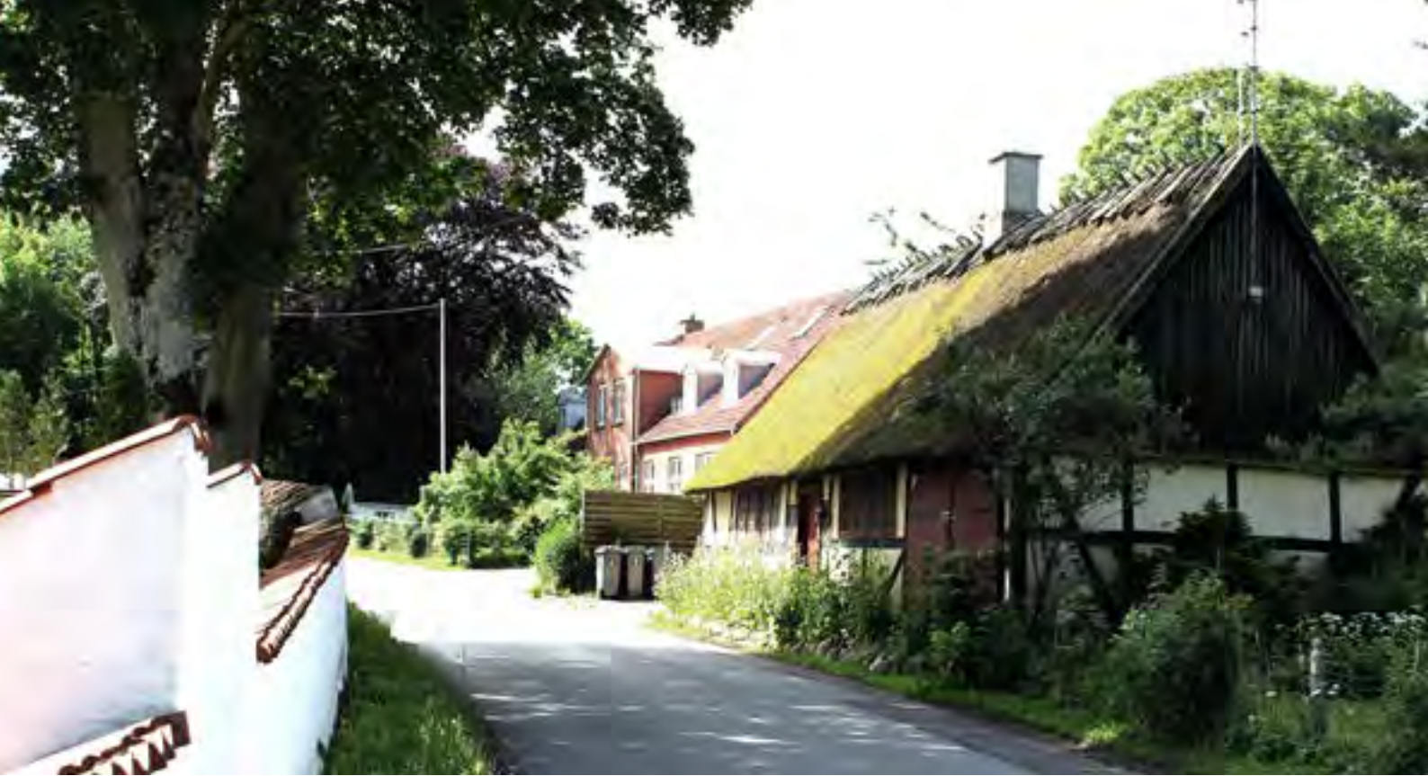
Bygaden med De Gamles Hjem i baggrunden