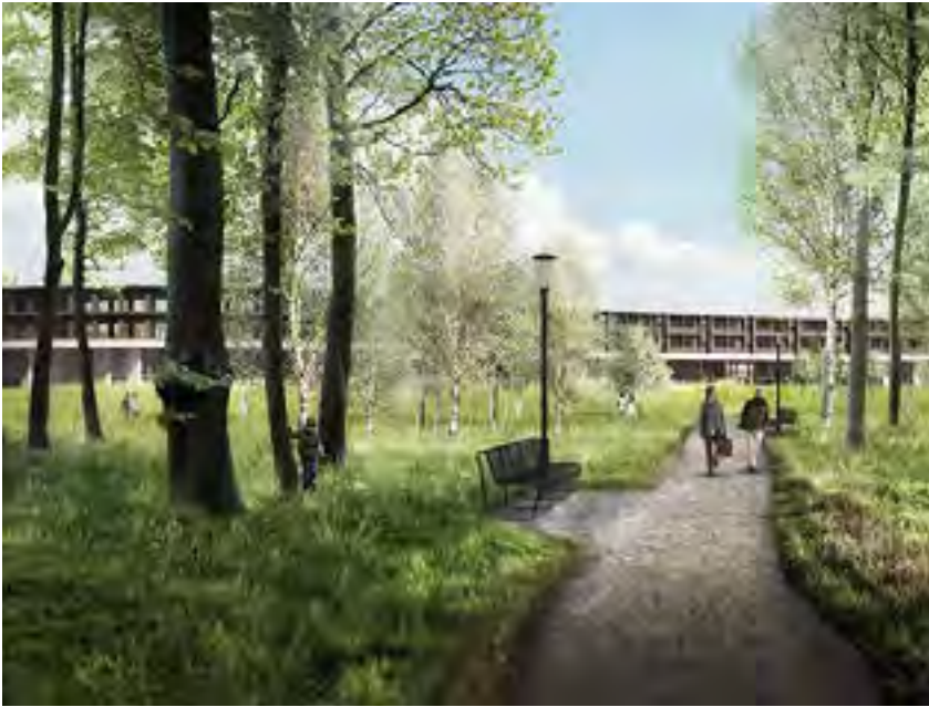
Visualisering nytHospital Nordsjælland.