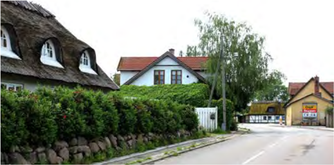
Byvej med Brugsen for enden er en vigtig gade med handel og erhverv