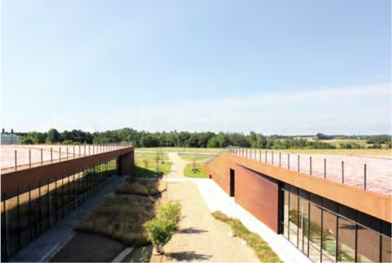
Renseanlæg (2017), Hillerød Forsyning, Henning Larsen Architects - arkitekturen bliver en forlængelse af landskabet