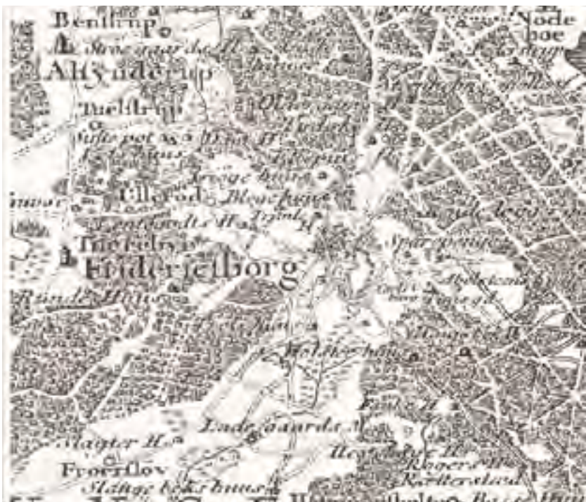
Videnskabernes selskab 1771

tydeligt at se på 1771 kortets nederste, højre hjørne. Lige som miljøet omkring Frederiksborg Slot med sin sø, bakker og skov kan ses som et koncentrat i miniatureform af det store nordsjællandske landskab, kan slottets barokhave ses som et koncentrat – "stedet i en suppetarning!" – af parforcejagtskoven. Men omsat i en både kunstfærdig og kunstnerisk form. Det var fra Ludvig XIV's Versailles, at moden med barokaver og parforcejagt bredte sig ud over Europa.