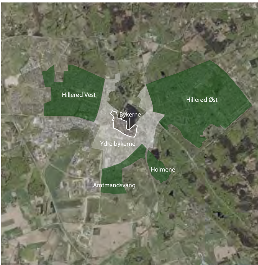
De ældre boligområder er markeret med grønt - grænsen er dog flydende, da boligområderne fletter ind i den ydre bykerne fra både øst, vest og syd.