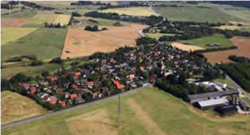
Nørre Herlev: en tydelig kontrast mellem land og by. Byens klare kant mod det åbne land, er en landskabelig kvalitet vi skal værne om.