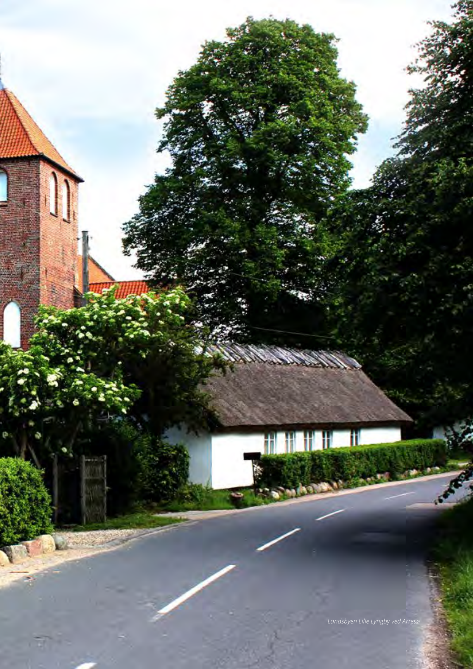
Landsbyen Lille Lyngby ved Arresø