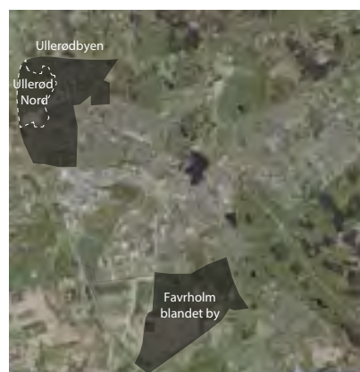
Favrholm og Ullerød Nord er Hillerøds største byudviklingsområder

I Livskraftprojektet vil vi sammen med Nyt Hospital Nordsjælland blande kunst, kultur, byudvikling, hospitalsvæsen og forskning og udfordre rammerne for den måde vi forstår sundhed på. Det er ambitionen at blive en rollemodel, der kan inspirere internationalt og danne ny praksis.