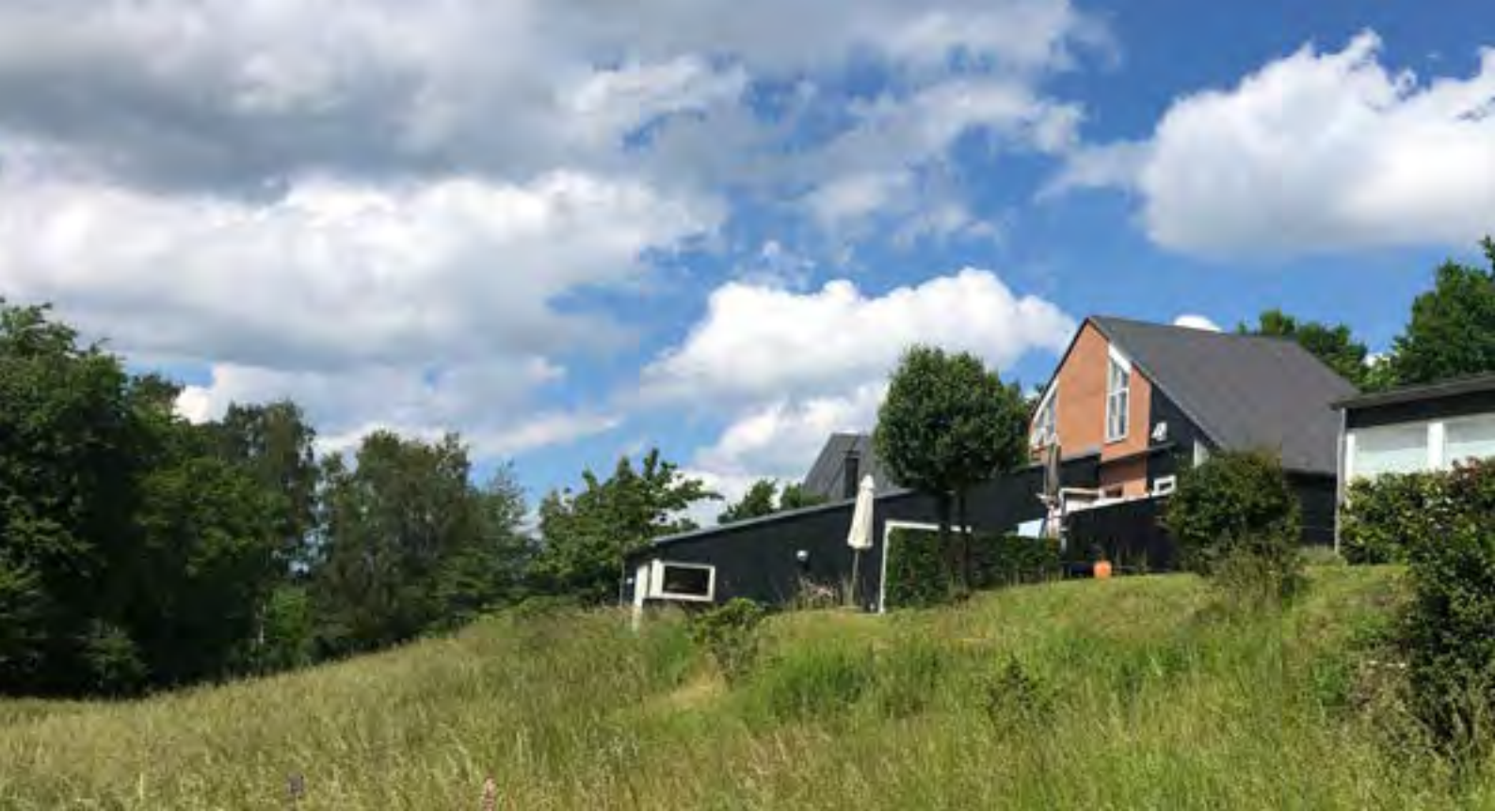
Kulsvierhusene (1986) i Gadevang, Tegnestuen Vandkunsten