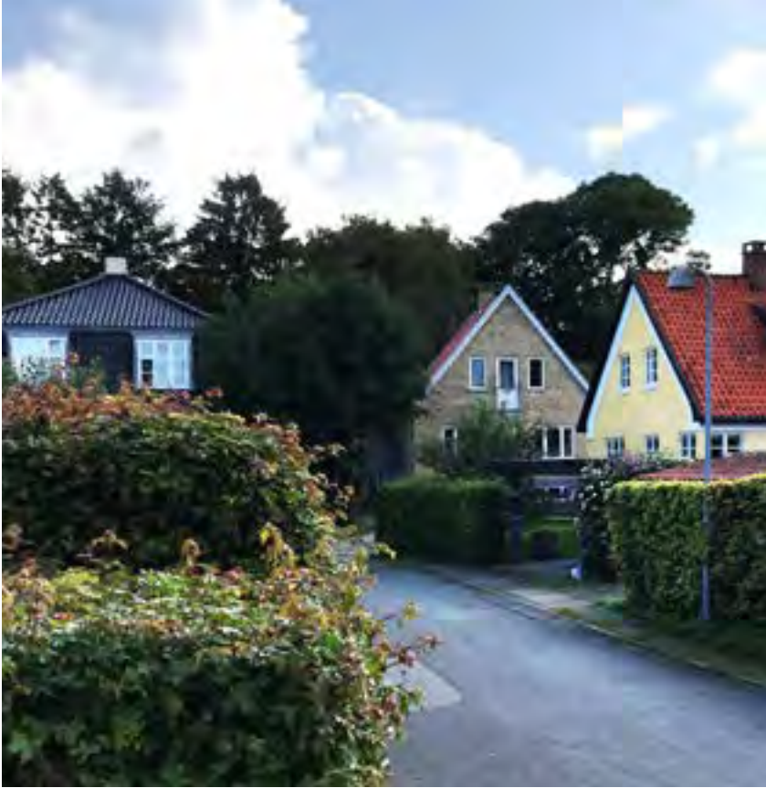
Randbeplantningen i de ældre boligbebyggelser danner ofte en markant grøn struktur med buske og træer.