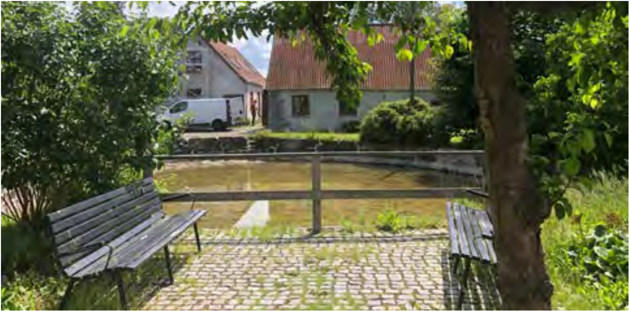
Gadekæret i Alsønderup