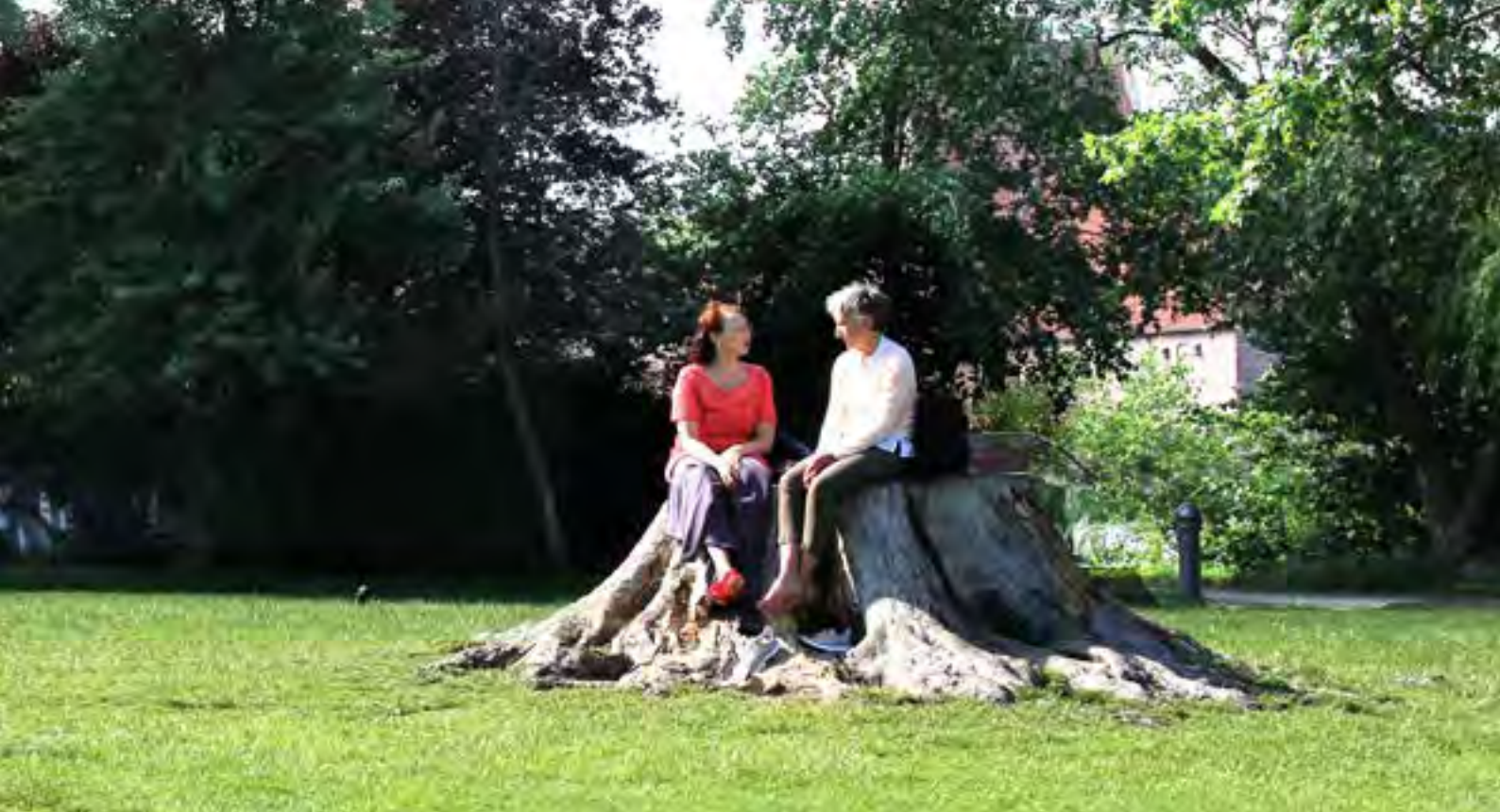
Posen i Hillerød: En afskåret stamme fungerer som siddeareal.