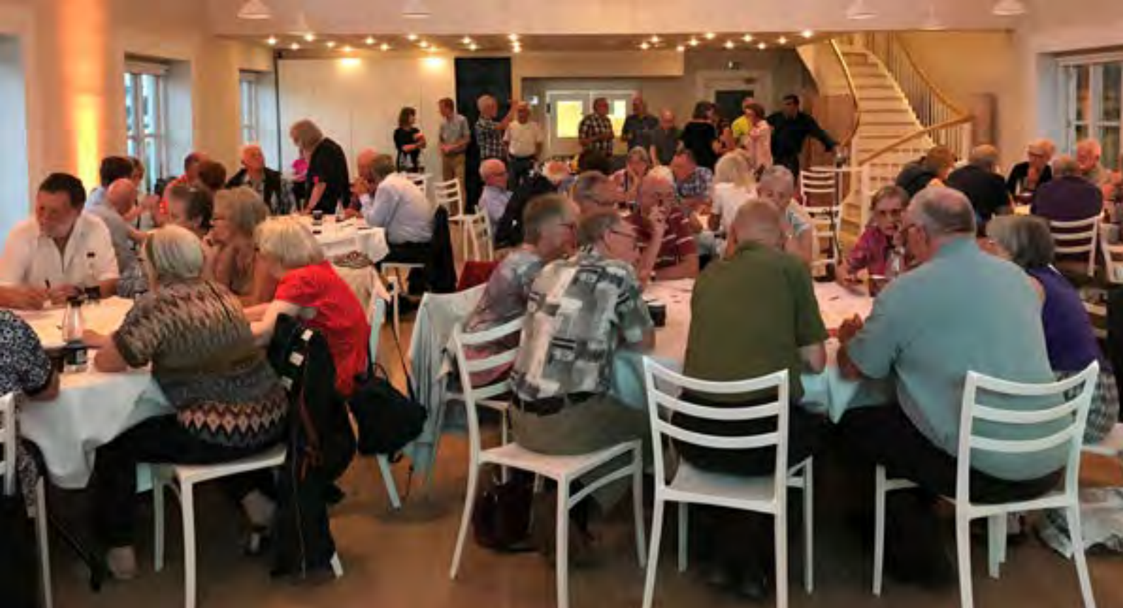
Arkitekturpolitikken drøftes på borgermøde