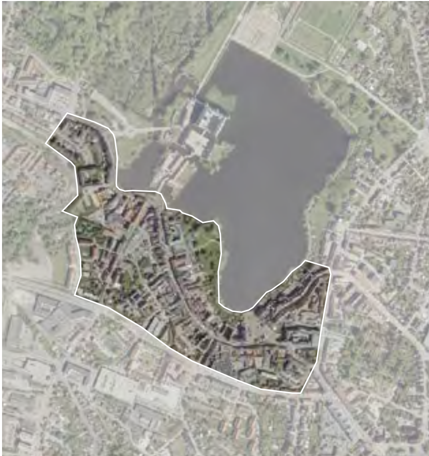
Den indre bykerne er afgrænset af Helsingsørsgade, Østergade, Hostrupsvej, Nordstensvej, Herredsvejen, Klostervej og Løngangsgade.