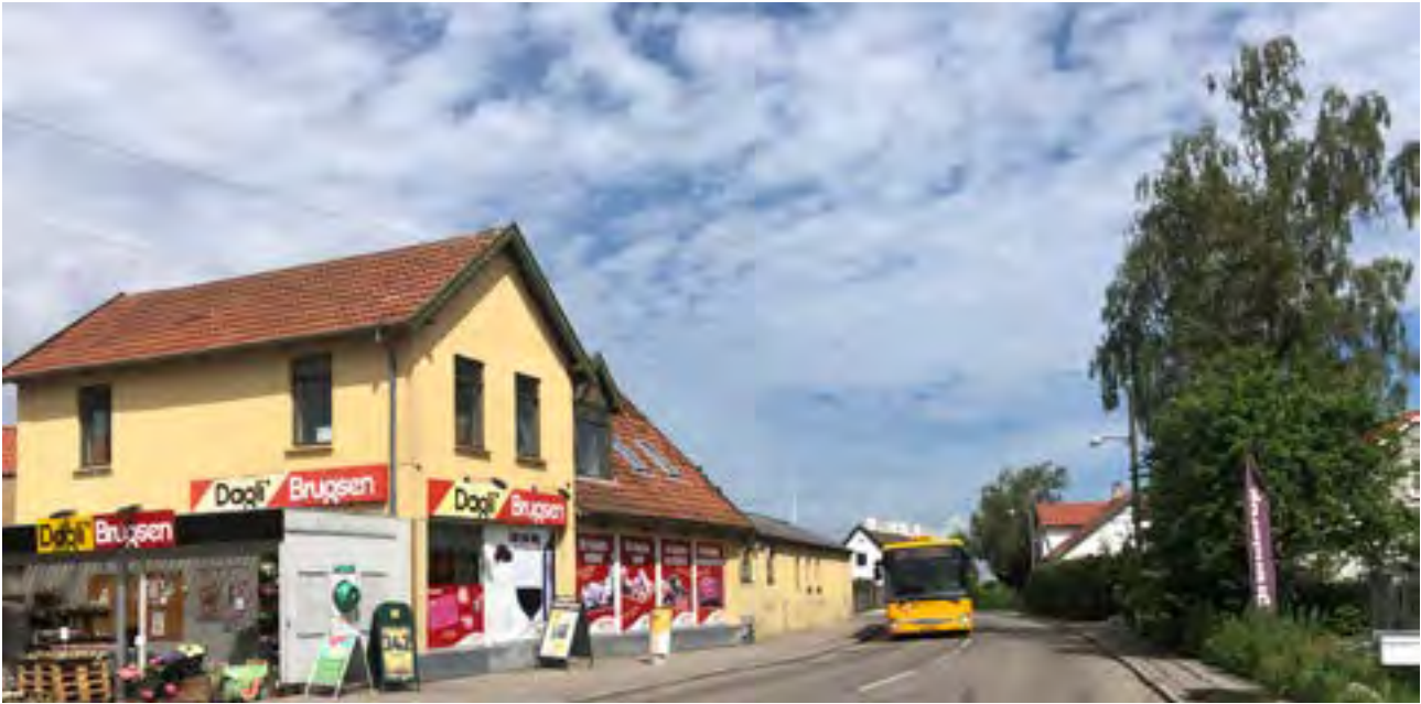
Brugsen v. Uvelse er et vigtigt samlingssted for lokalsamfundet.