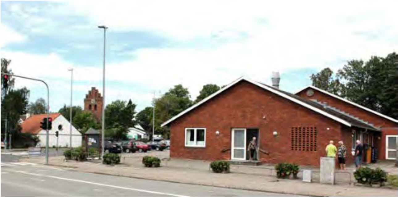
Gørløses forsamlingshus med kirken i baggrunden