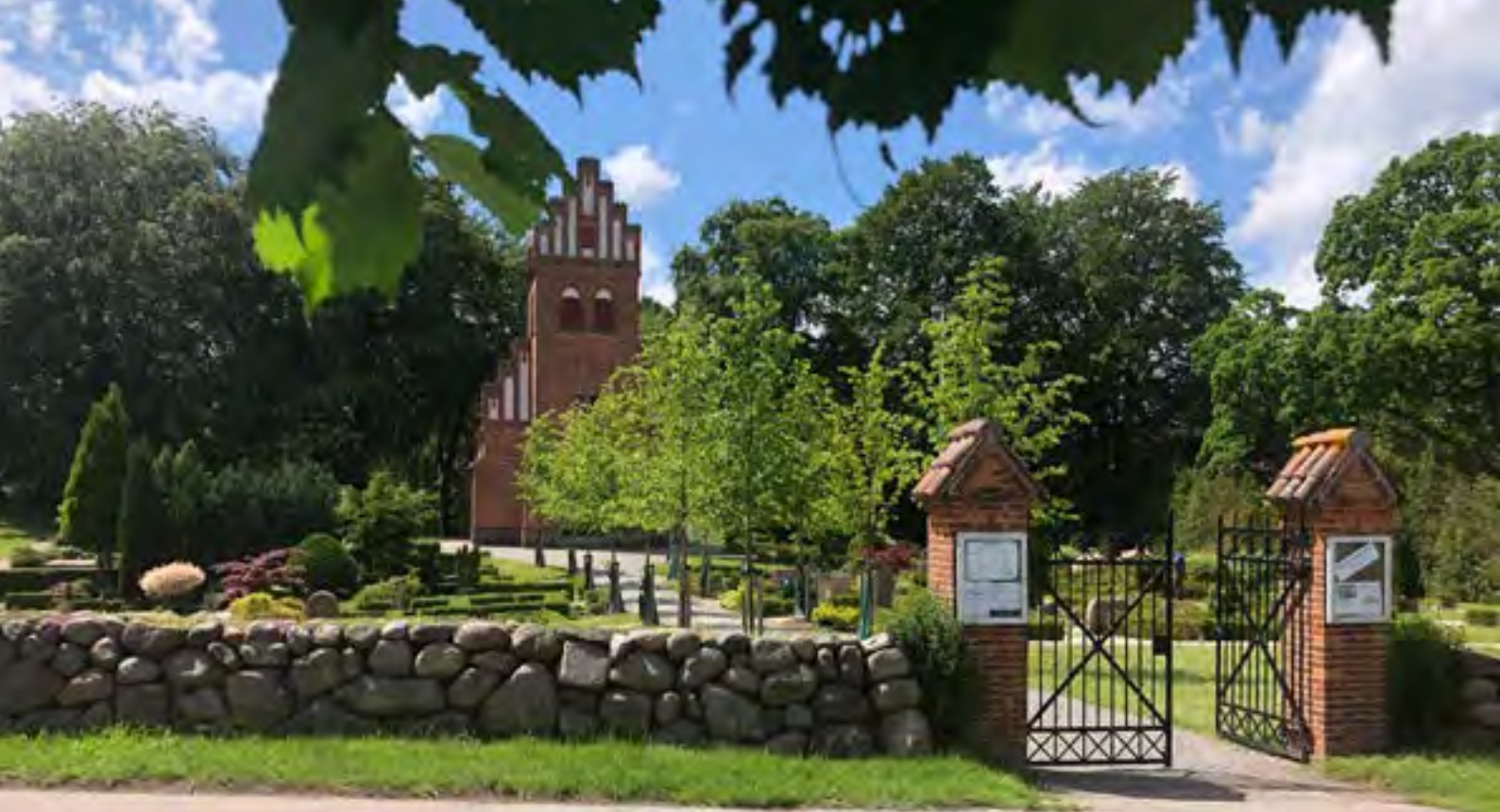
Kirkemiljøet i Gadevang

rige kulturarv som en stor del af i de små bysamfunds offentlige rum udgør. De kan med omtanke og beskedne midler forbedres, udvikles og varieres. Det kan være en samlende plads, hvor byens butik eller butikker ligger. Det kan være forbedringer med siddepladser, pergola og plantninger ved busholdepladser eller evt. station. Og det kan måske være et mindre anlæg ifm. gadekær og kirkeomgivelser.