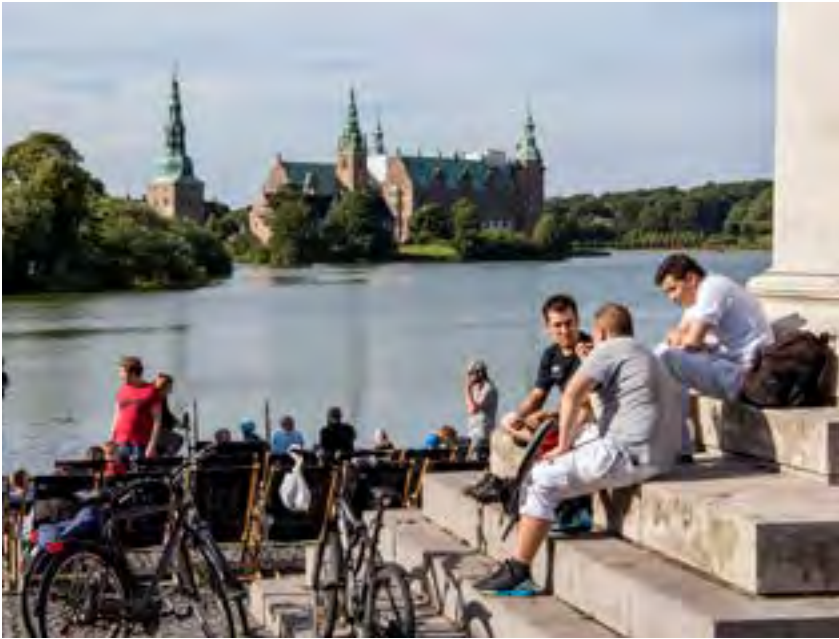
Overalt i den indre bykerne er slottet synligt og nærværende.