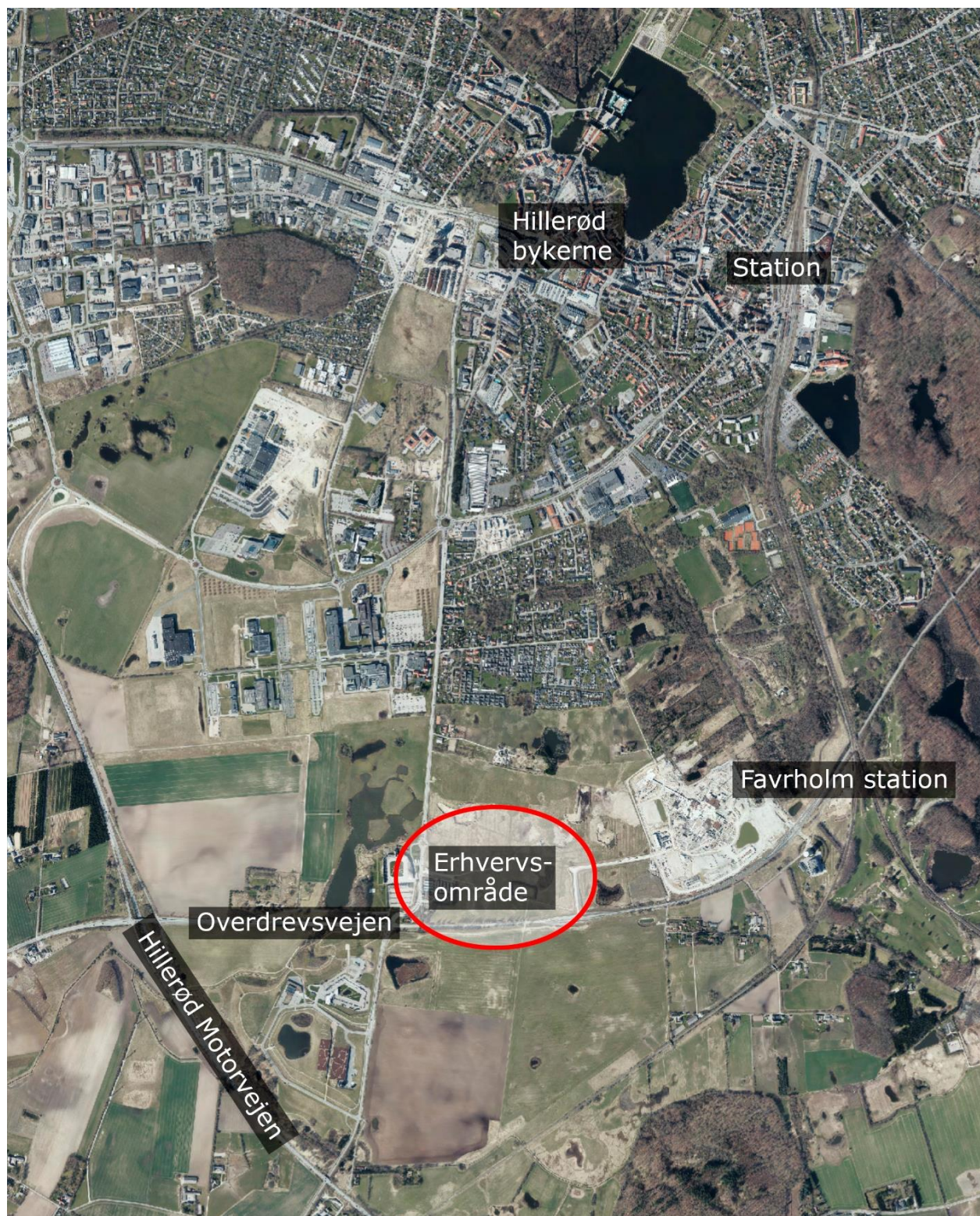
Billedet viser Erhvervsområdets placering, som ligger ca. 10 minutters kørsel fra Hillerød Bykerne og tæt på den nye S-togsstation og Hillerød motorvejen.