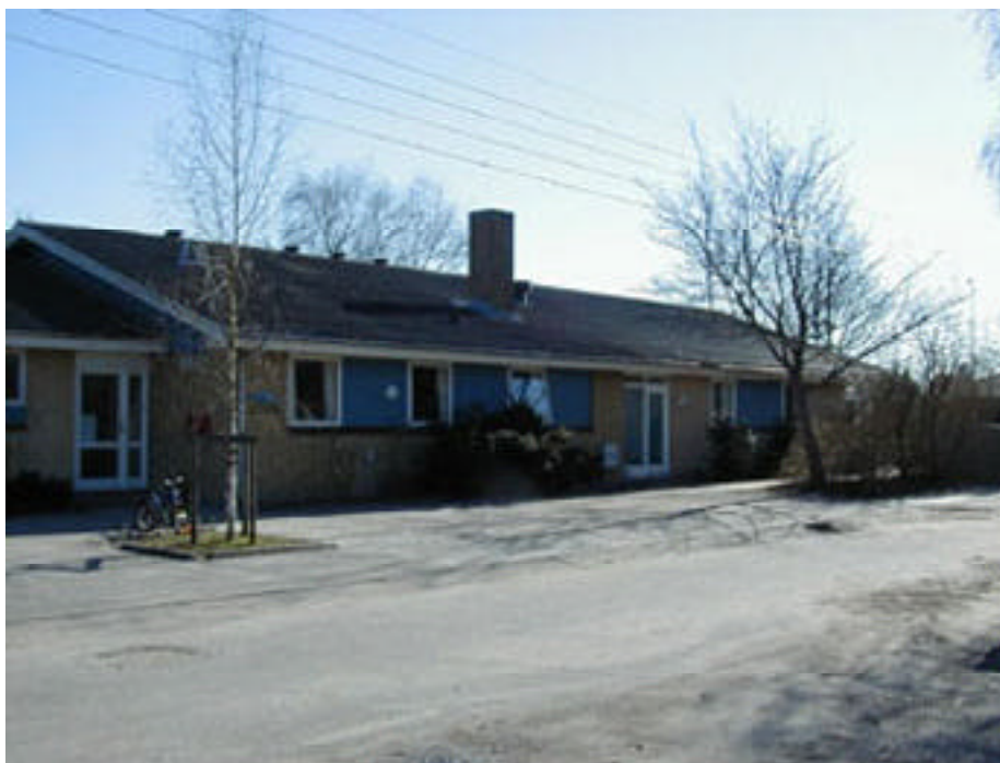
Uvelse Børnehave set fra Kornvænget

Delområde IV udgør området langs adgangsvejen fra Gørløsevej, samt områder med parkeringsarealer både øst og vest for denne adgangsvej.