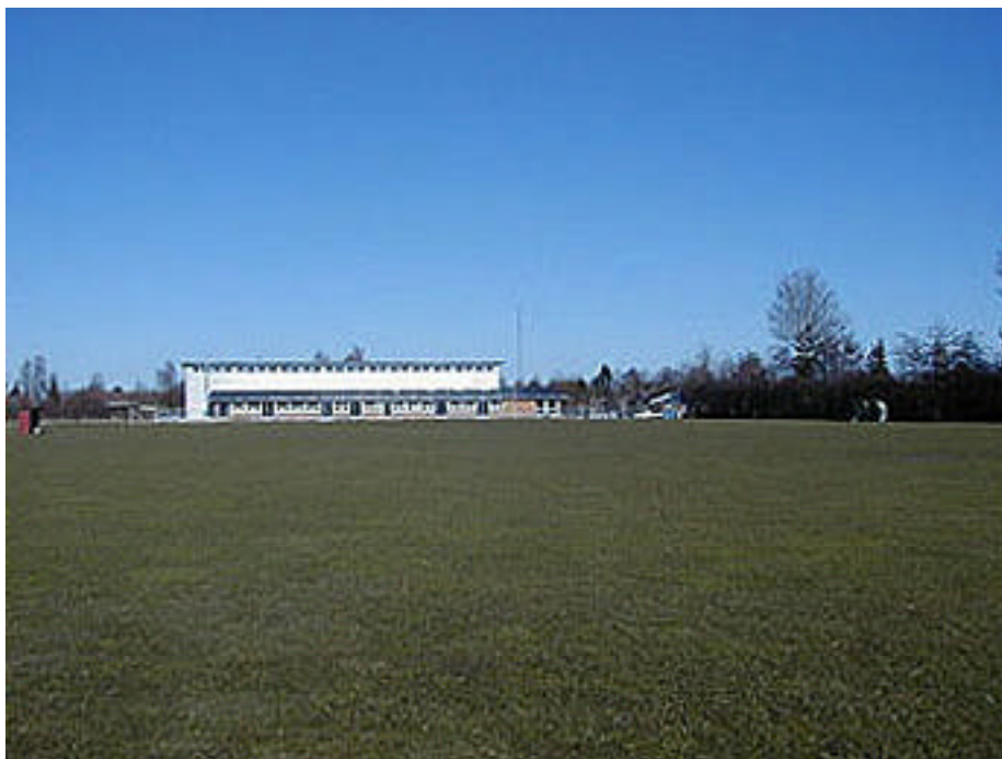
Uvelse Fritids Center Halbygningen set fra syd fra bold- banerne.

at sikre bevaring af eksisterende plantebælter, samt etablering af ny afskærmende beplantning mod nord og vest ved lokalplanens afgrænsning mod fremtidigt boligområde og mod sti.